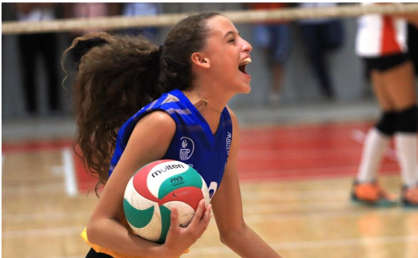
(La euforia del deporte. Integrante del equipo de voleibol femenino de Itagüí. Itagüí venció 3 – 0 a Rionegro en la final y se coronó campeón del torneo. Las Itagüiseñas suman, con este, seis campeonatos de voleibol en la 44 ediciones de los Juegos Departamentales “Indeportes Antioquia” e igualan a Rionegro que también lleva seis. El máximo ganador de voleibol femenino en los Juegos Departamentales es El Santuario con once títulos.)

Programación deportiva del miércoles 15 de diciembre.