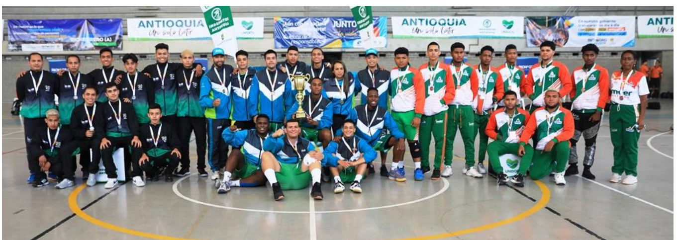
(Equipos medallistas de balonmano, de izquierda a derecha, Guarne (plata), Medellín (oro) y Apartadó (bronce).

Oficina Asesora de Comunicaciones - Indeportes Antioquia Oficina de Prensa. Teléfono: 520 08 90, ext. 1035 prensa@indeportesantioquia.gov.co