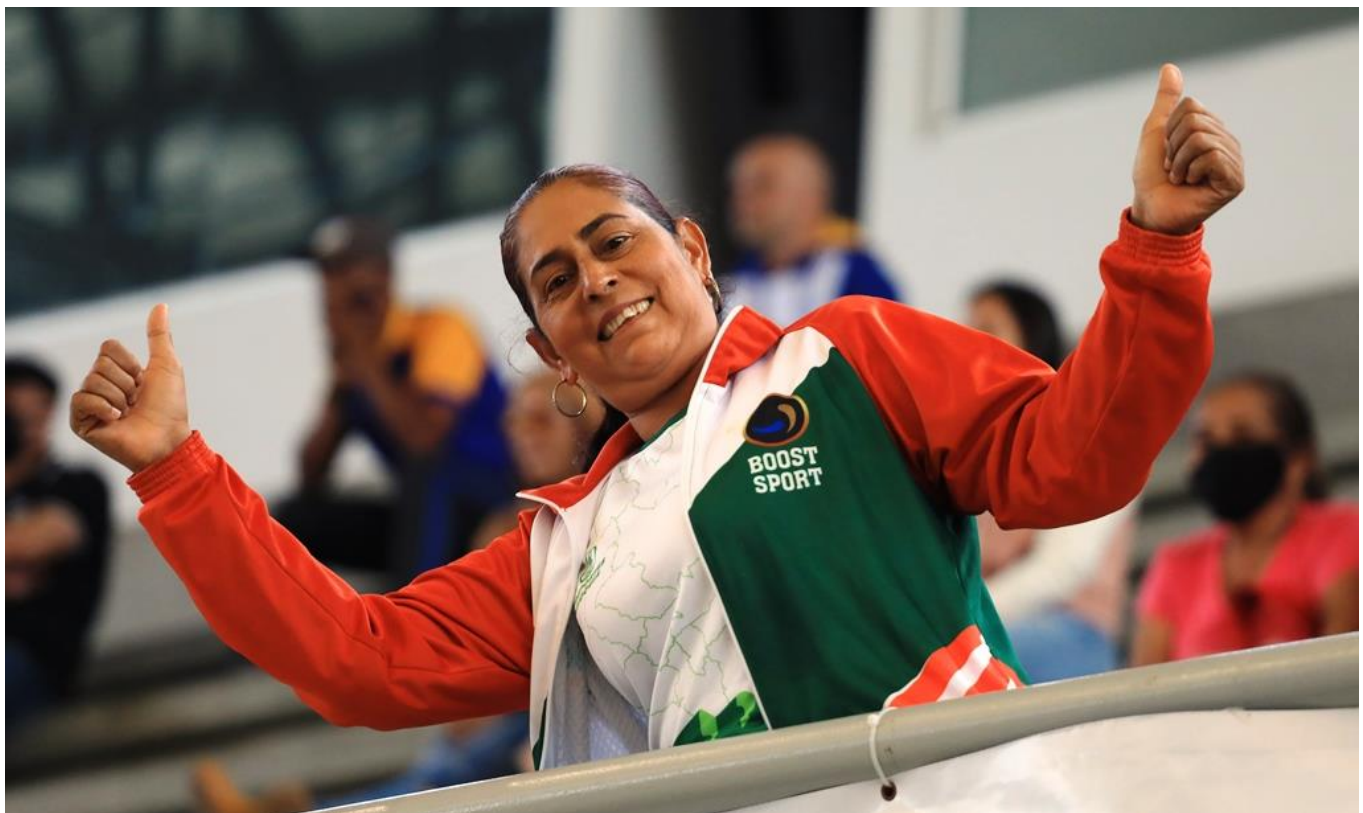
(Aficionados en los escenarios y acompañantes de las delegaciones disfrutan de los Juegos Deportivos Departamentales "Indeportes Antioquia" 2021.)

Oficina Asesora de Comunicaciones - Indeportes Antioquia Oficina de Prensa. Teléfono: 520 08 90, ext. 1035 prensa@indeportesantioquia.gov.co