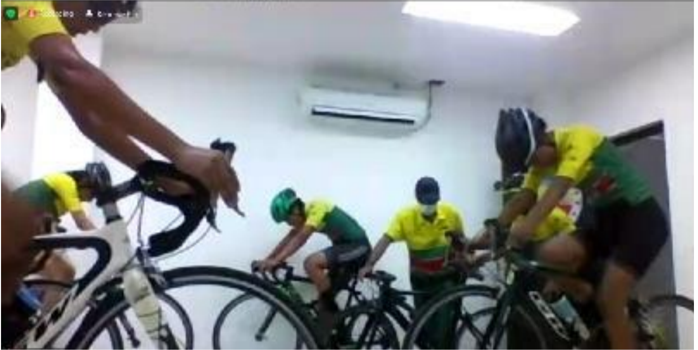
(Ciclistas de Tarazá, Bajo Cauca, en competencia.)

Londoño, convocan cerca de 3 mil deportistas de 60 poblaciones de las nueve subregiones del Departamento.