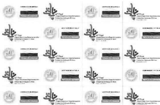
Medalla Área: 7cm x 7cm / Acabados: Oro, Plata y Bronce Lado A: grabado en alto relieve / lado B: Sticker full color con laminado mate