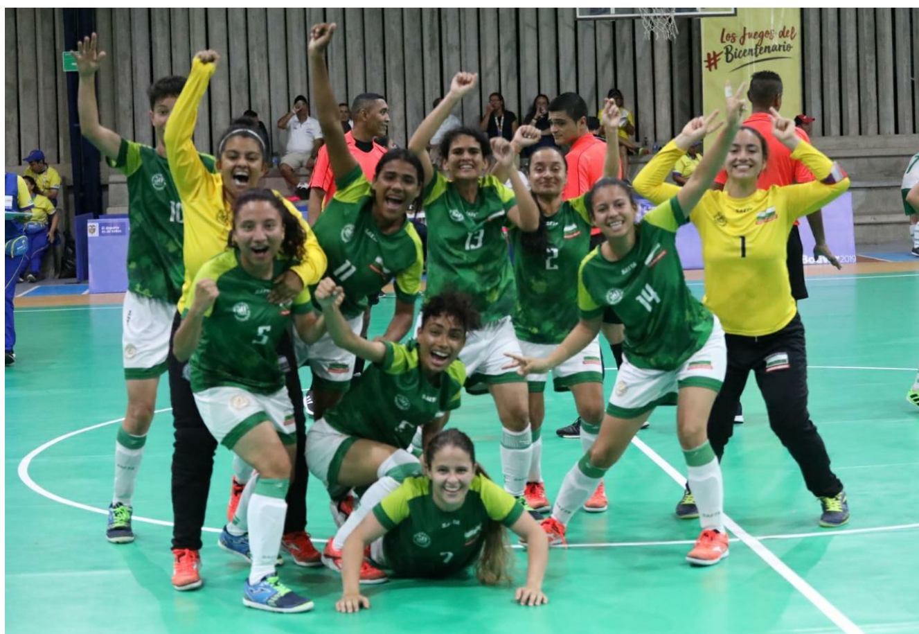
Antioquia campeón de fútbol sala femenino auditivo. Venció a Boyacá 3-1 en la final.

Este sábado, penúltima fecha del certamen deportivo paranales