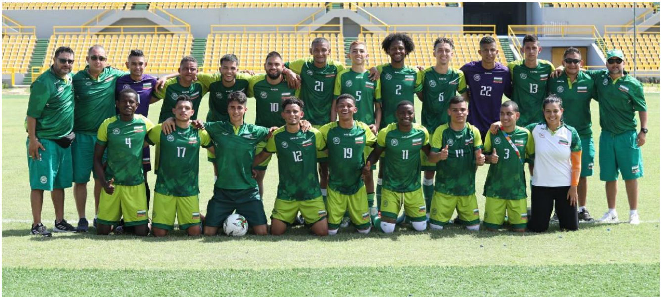
Fútbol auditivo de Antioquia.