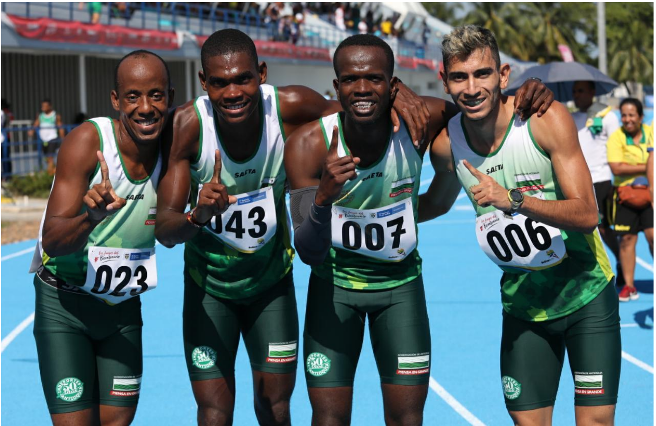
Equipo de 4x400 metros masculino auditivo. Medalla de oro de Antioquia.