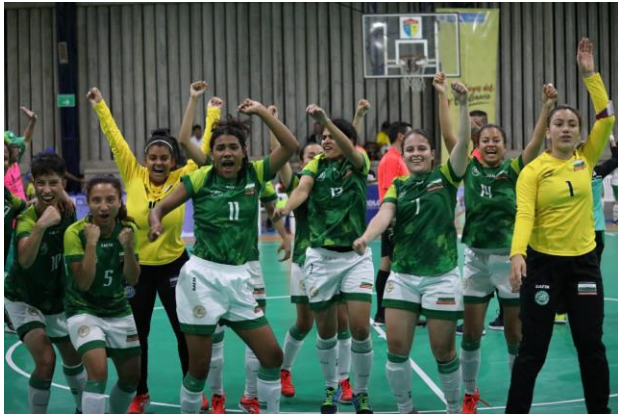
Las chicas de fútbol sala celebran su campeonato.

Con los títulos para Antioquia en femenino y Valle del Cauca en masculino, terminó el torneo de fútbol sala auditivo de los quintos Juegos Paranales Bolívar 2019.