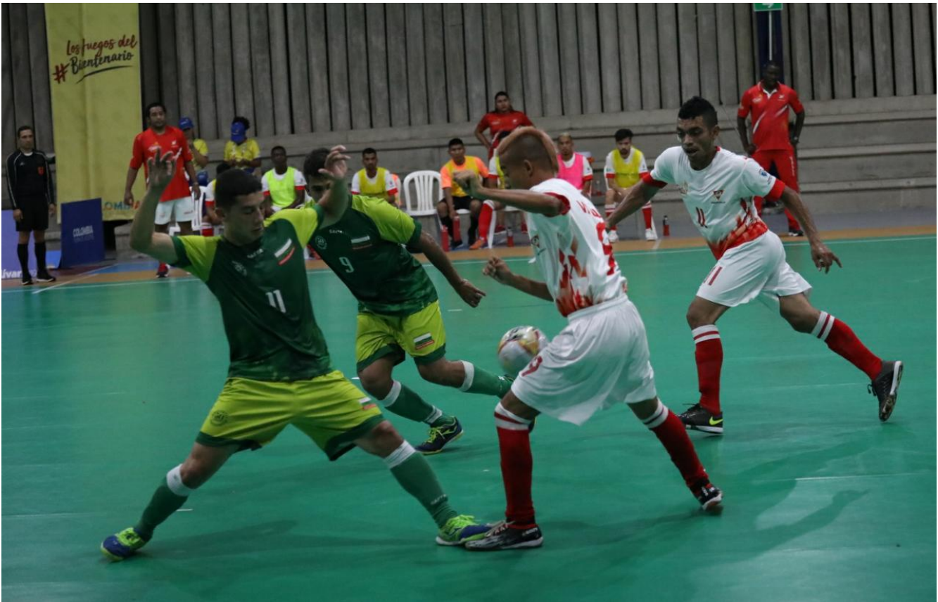
Antioquia subcampeón de fútbol sala auditivo masculino.