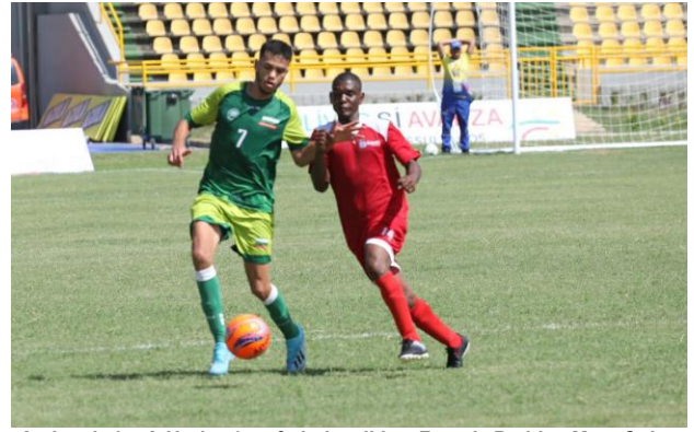
Antioquia 3 - Atlántico 0 en fútbol auditivo.

Después de vencer a Bogotá 3, a La Guajira 10 y Atlántico 3-0, la selección Antioquia de fútbol masculino auditivo llegó a la semifinal, la que se jugará este sábado 7 de diciembre a las 07:00 hora ante Norte de Santander.