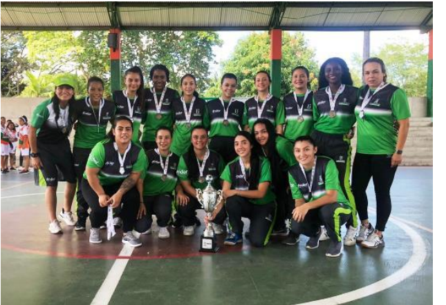
Equipo de balonmano de Medellín, campeón del torneo en la rama femenina (Foto: cortesía).