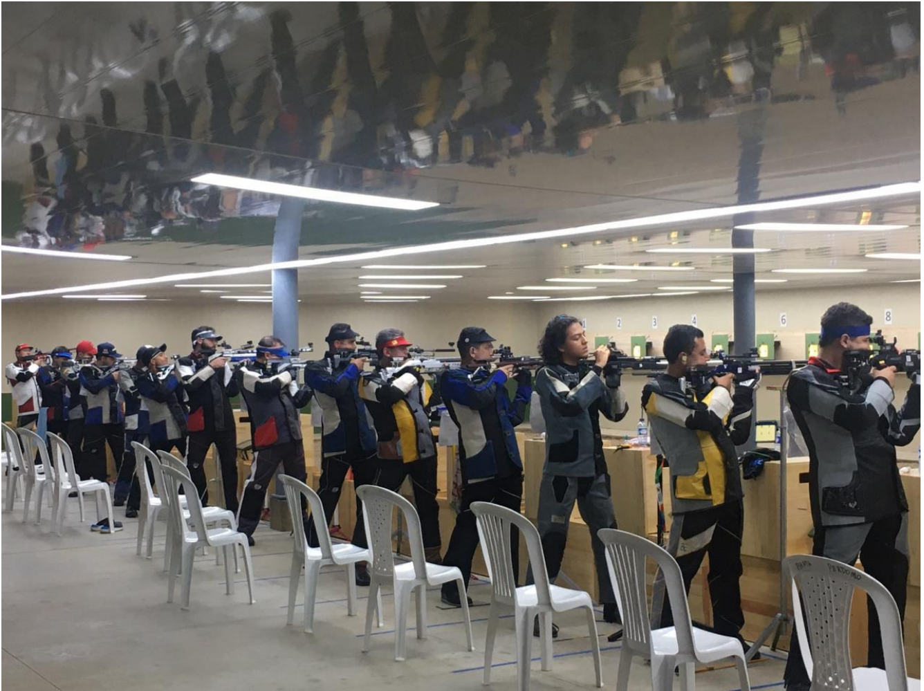
En la imagen, tiro deportivo en Nilo, Cundinamarca.