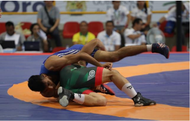
En la imagen, competencias de lucha.