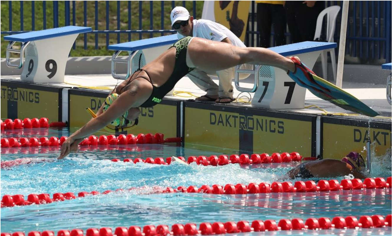
Competencias de actividades subacuáticas.

Por: Carlos Arturo Castañeda Quant – Periodista de Antioquia en Magangué.