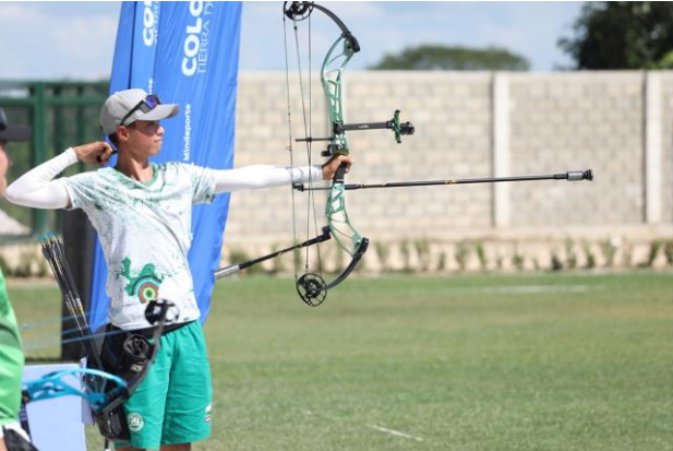
En la imagen, arquero de Antioquia en acción.