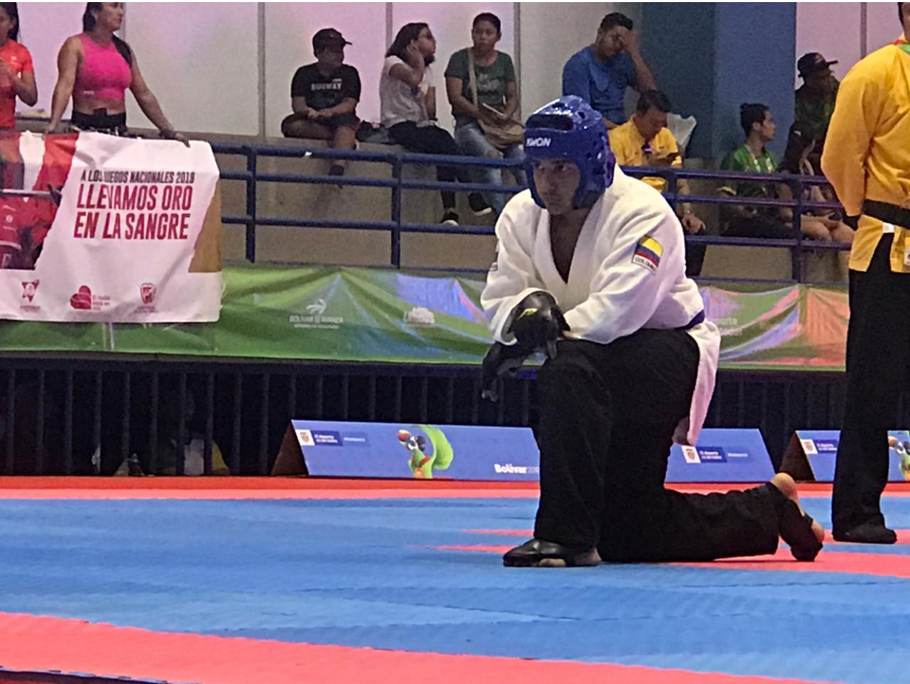
Hapkido antioqueño en Cartagena de Indias.