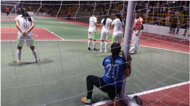
Antioquia fue cuarta en futbol de salón femenino.

Por: Carlos Arturo Castañeda Quant – Periodista de Antioquia en Magangué.