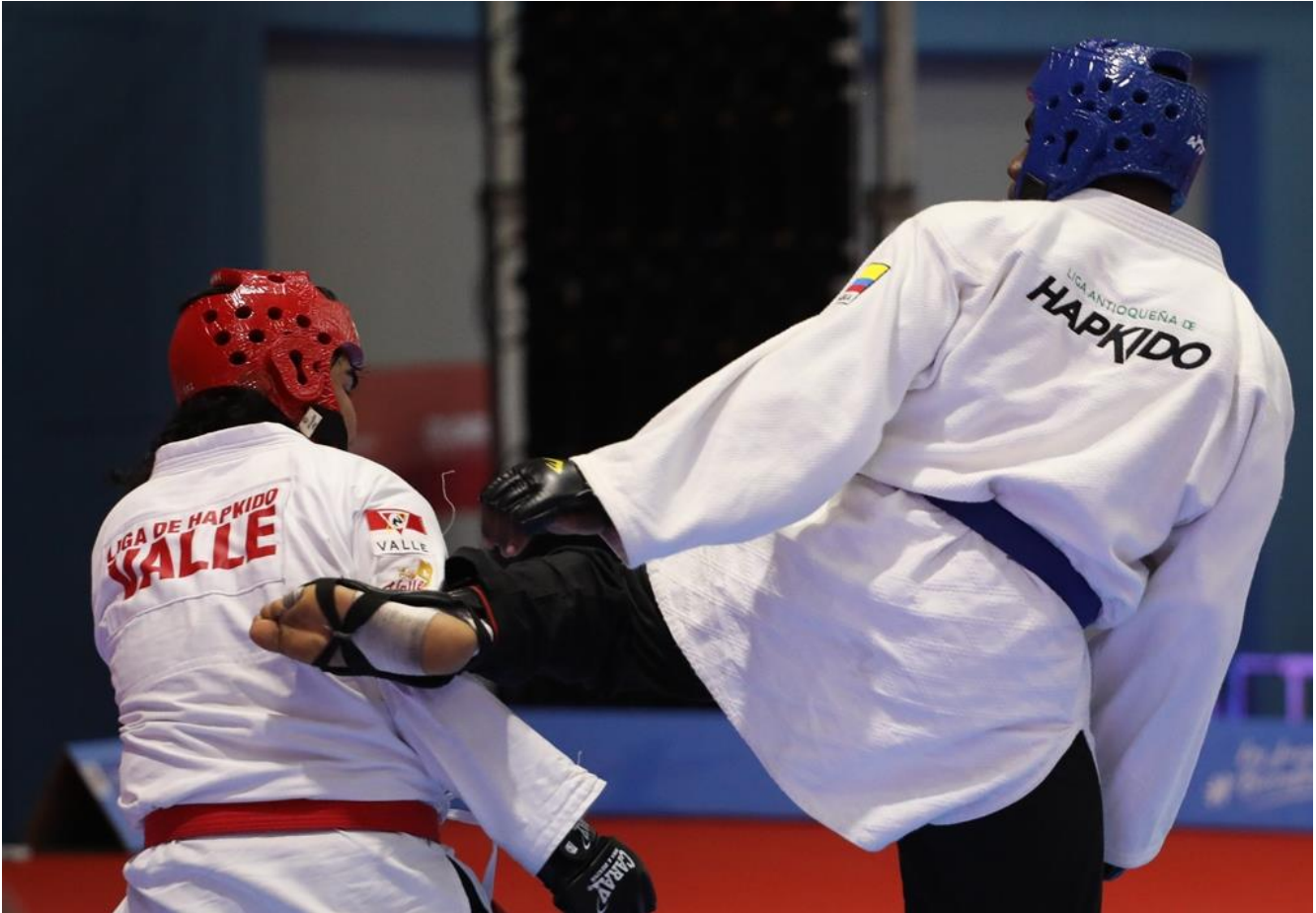
En la imagen, hapkido de Antioquia frente al Valle del Cauca.