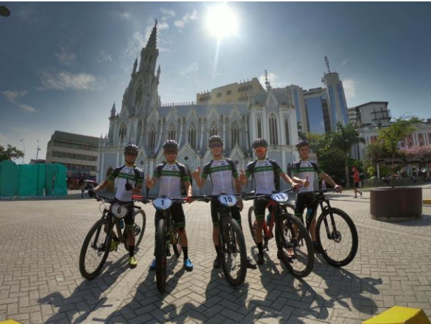
Ciclomontañismo de Antioquia.

Por: Marco Antonio Garcés-Periodista Indeportes Antioquia en Cali