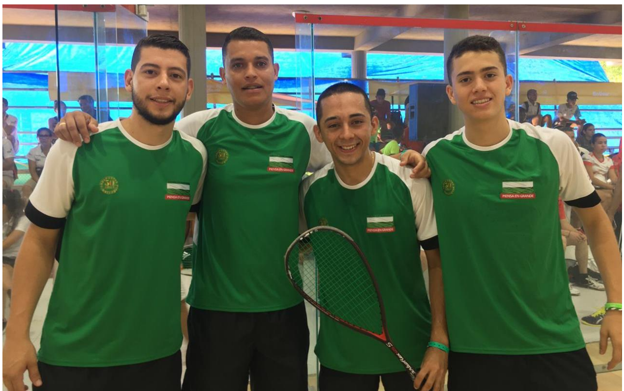
Equipo de squash masculino.

El tiro deportivo es liderado, parcialmente, por Bogotá con siete oros, seis platas y tres bronce.