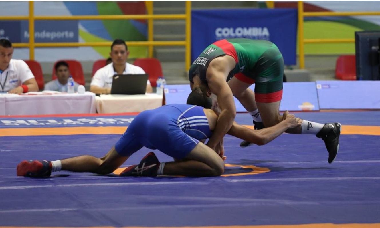
En la imagen, lucha libre de Antioquia en Cartagena.

Antioquia obtuvo oro y bronce en el Cross Country masculino en Yumbo