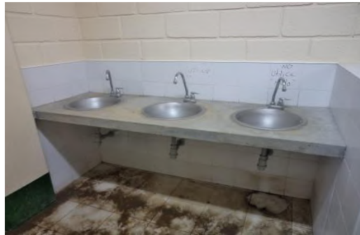
Lavamanos Fuera de Servicio por fugas

El acta de recibo final de la obra, se suscribió el día siete (7) de diciembre de 2015, sin embargo, en la visita realizada por la CGA se encontró en condiciones de descuido las instalaciones del escenario deportivo, como se evidencia en las siguientes imágenes: