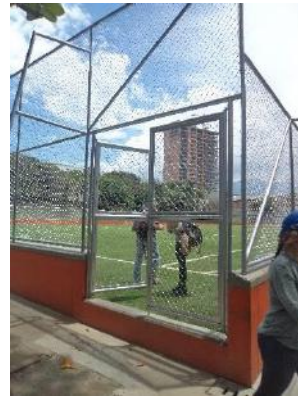
Cancha sintetica, cerramiento y andenes

Por encontrarse el convenio y contrato sin liquidar, deberá ser objeto de revisión en la siguiente vigencia.