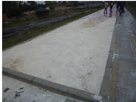
Gimnasio al aire libre y arena de saltos

Por encontrarse el contrato sin liquidar, deberá ser objeto de revisión en la siguiente vigencia.