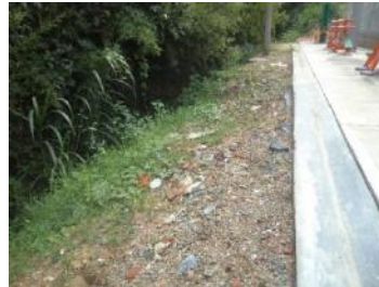
Talud en riesgo de erosión

Por encontrarse el convenio sin liquidar, deberá ser objeto de revisión en la siguiente vigencia.