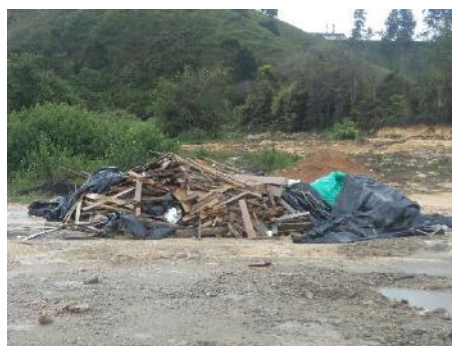
Acceso con aguas lluvias represadas y escombros provenientes de la construcción en el municipio de Yolombó

En el análisis del A.U. se estimaron costos para cerramientos provisionales, actividad que ya se encuentra pagada dentro de los costos directos del proyecto, hecho que constituye un presunto detrimento patrimonial, conforme