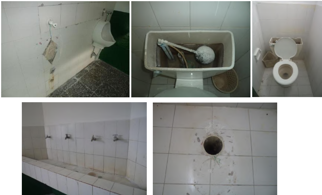
Estado actual de las unidades sanitarias