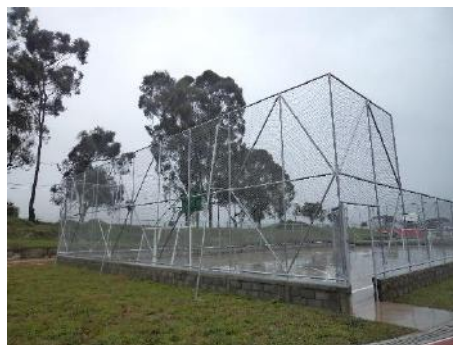
Pista atlética y placa polideportiva