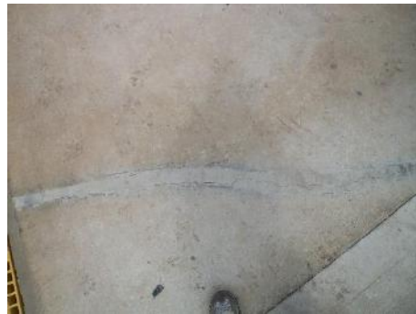
Fractura de andén en la entrada al escenario y fisuras presentadas en andenes perimetrales en el escenario de Entreríos