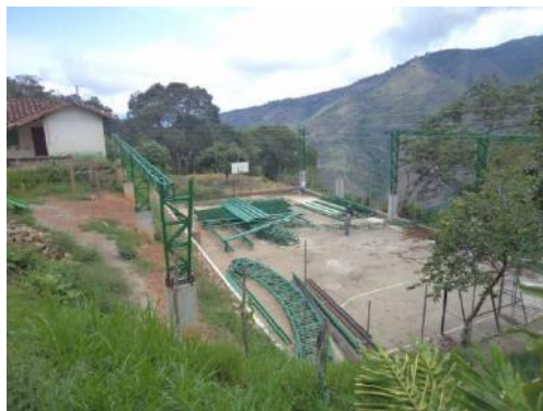
Proyecto: Construcción de la cubierta en la placa polideportiva de la vereda rojas en el corregimiento de guayabal sin ejecutar.

El contrato de obra No. 060 de 2015 se encuentra suspendido desde el día 18 de diciembre de 2015, fecha que de acuerdo a los documentos reportados en Gestión Transparente y en el expediente del convenio que reposa en Indeportes venció el plazo de ejecución del contrato, sin que se demuestre otra actuación mediante la cual se haya ampliado el plazo de ejecución así como la ampliación de la Garantía única del contrato. Además la suspensión se sustenta por el traslado de la red de energía eléctrica que atraviesa la placa polideportiva de la vereda Rojas del corregimiento Guayabal. Hecho que evidencia falta de gestión administrativa que propenda al buen desarrollo y ejecución del contrato, ya que en la visita realizada se evidenció que la obra en éste corregimiento se encuentra inconclusa y con la estructura metálica para la cubierta a la intemperie, hecho que pone en riesgo los recursos ya pagados al contratista por las actividades de cimentación de la cubierta y la inversión en la compra de la estructura metálica de ésta.