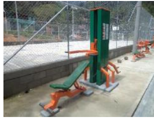
Gimnasio al aire libre