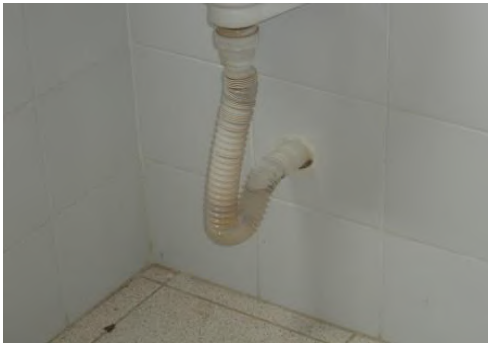
Tubería desagüe Orinales

no cumplen con las especificaciones técnicas de la NTC 5456 así como, el de reinstalar o adecuar algunos de los acoples de la grifería de los lavamanos por cuanto presentan fugas al momento de ponerlos en servicio. Lo anterior se muestra en las siguientes imágenes: