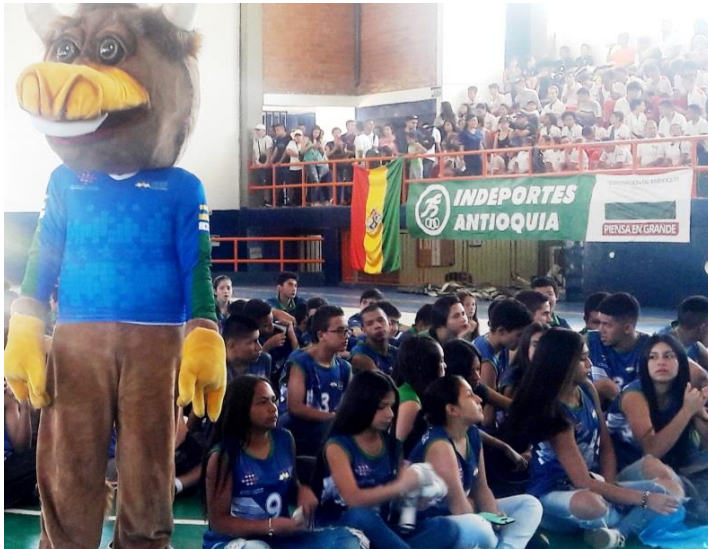
Foto. La mascota Tornillo, con los jóvenes estudiantes.

La Estrella, Antioquia. (Oficina de Prensa Indeportes Antioquia – Boletín 03-2018). Con una colorida, sencilla, alegre y sentida ceremonia, fue inaugurado este martes 7 de agosto en el coliseo cubierto de Unidad Deportiva del INDERE, en La Estrella, el zonal del Valle de Aburrá de los Juegos Supérate Intercolegiados, certamen en el que se dan cita los deportistas-estudiantes de las 10 poblaciones de esta región del departamento de Antioquia, quienes buscarán clasificar en 13 disciplinas atléticas a las finales departamentales de las categorías infantil y prejuvenil, en Bello, y de la juvenil, en Jericó.